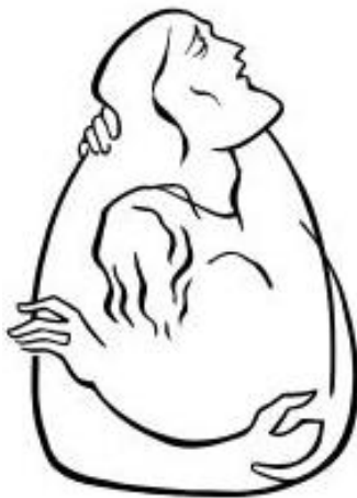
Hazatérés – Tékozló fiú Simon András grafikája

A kép a maga teljességében azt is ábrázolja, hogy a zarándok útvonala nem egyéni, hanem dinamikus közösségi esemény, amely a kereszt felé irányul. A kereszt is dinamikus mozgásban van, az emberiség felé hajol, hogy elébe menjen és soha ne hagyja magára, hanem felkínálja számára a jelenlét bizonyosságát és a remény biztonságát.